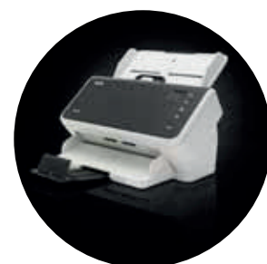
Scanner Alaris S2040/S2050/S2070