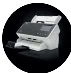
Scanner Alaris S2060w/S2080w